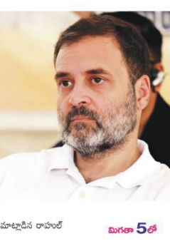
యదాద్రివారి, పెద్దపల్లి, 21 నవంబరు : ఈ సోలోలో కింద కూర్చున్నది పెద్దపల్లి కలెక్టర్ ముఖ్యమంత్రిని నిర్బంధించినట్లు

యదాద్రివారి, మ్యాడ్రీ, 21 నవంబరు : ప్రధాని నరేంద్ర మోడీపై కాంగ్రెస్ అధినేత రాహుల్ గాంధీ విమర్శలు గుప్పించారు. అదివారం జరిగిన ఆస్ట్రేలియా-ఇండియా వరల్డ్ కప్ ఫైనల్ మ్యాచ్ ను ప్రస్తావించారు. తీవ్ర విమర్శలు చేశారు. రాజస్థాన్ అసెంబ్లీ ఎన్నికల దగ్గర పడుతున్న నేపథ్యంలో ఆ రాష్ట్రంలో కాంగ్రెస్ తరుఫున ప్రచారం చేసిన రాహుల్ గాంధీ, పీఎం మోడీని ట్యాగ్ చేశారు. భారత్ గెలవకపోవడానికి ప్రధాని మోడీనే కారణమని యుద్ధాల్లారు. జిల్లాలో మంగళ వారం జరిగిన ర్యాలీలో మాట్లాడిన రాహుల్