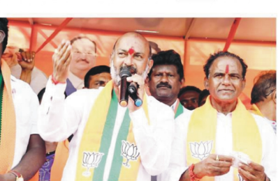
కలిసి బెజ్జంకిలో నిర్వహించిన రోడ్ షోకు భారీ ఎత్తున ప్రజలు హాజరయ్యారు. ఈ సందర్భంగా బండి సంజయ్ మాట్లాడుతూ కేసీఆర్ కు ఓట్లని