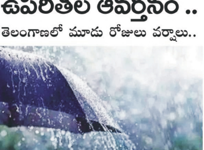
యదాద్రివారి, హైదరాబాద్, 21 నవంబరు : తెలంగాణలో వర్షాలపై చాలావరణకాశ కీలక ప్రకటన చేసినది. వచ్చే మూడు