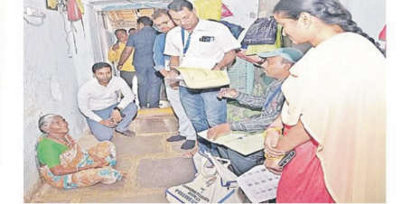
యదాద్రివారి, పెద్దపల్లి, 21 నవంబరు : ఈ సోలోలో కింద కూర్చున్నది పెద్దపల్లి కలెక్టర్ ముఖ్యమంత్రిని నిర్బంధించినట్లు

హైదరాబాద్ వనపర్తివరం ప్రశాంత్ నగర్ కాలనీలో ఇంటి నుంచే ఓటు వేస్తున్న 90 ఏళ్ల రాబకొండ కులశమ్మ